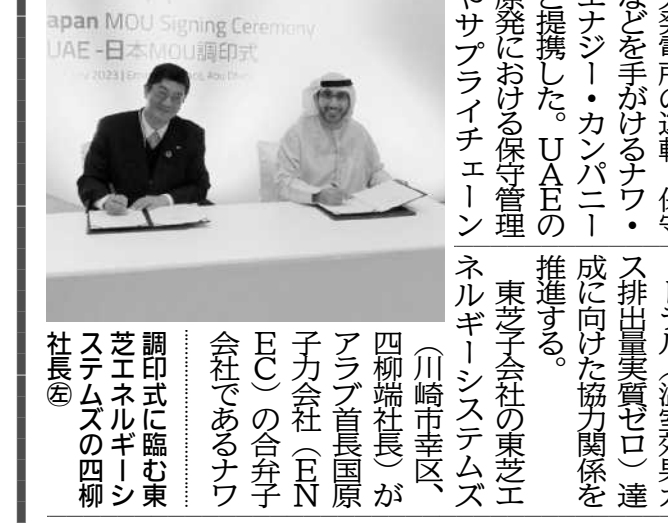
東芝はアラブ首長国連邦(UAE)の原子力発電所の運転・保守・メンテナンスを手がけるナフ・エナジー・カンパニーと提携した。UAEの原発における保守管理やサブライチエーション

東芝、UAE社と提携 原発保守・脱炭素など協力 東芝はアラブ首長国連邦(UAE)の原子力発電所の運転・保守・メンテナンスを手がけるナフ・エナジー・カンパニーと提携した。UAEの原発における保守管理やサブライチエーション