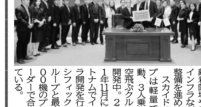
CTUVとJERAの戦略的な投資を実施し、再生可能エネルギーを推進する。

CVC専任部署を新設 JERA、420億円投資 JERAはエネルギー分野におけるイノベーションの加速や新規事業の創出を目的に、CVC専任部署を新設し、420億円を投資する。JERAはCVC分野で、再生可能エネルギーや人工知能(AI)など、最先端技術やイノベーションの加速や新規事業の創出を目的に、CVC専任部署を新設し、420億円を投資する。